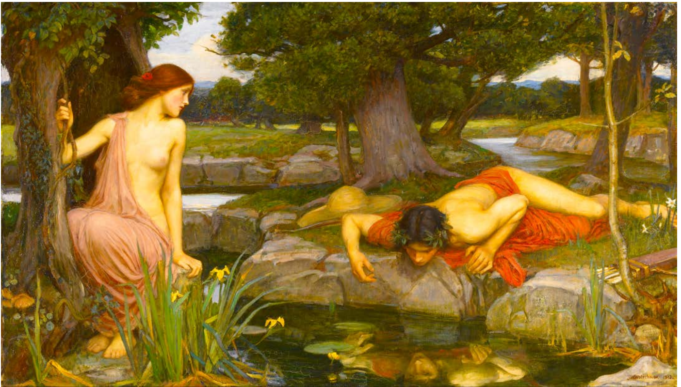
Echo et Narcisse , 1903 par John William Waterhouse, Walker Art Gallery, Liverpool

Une beauté prodigieuse nous fait signe en silence... Nous croyons parfois la distinguer sous toutes sortes de formes, de visages, de contours : elle est là devant, là-bas, plus tard. Le désir intense de la saisir une bonne fois nous saisit. Mais chaque fois, devant la main qui s'avance pour saisir, elle recule et s'évanouit. Que pouvons-nous saisir de vraiment substantiel et durable? Rien. C'est la frustration constante de nos vies et il convient qu'il en soit ainsi... Personne ne l'a jamais saisie, car c'est la Beauté qui est saisissante. Alors, c'est la peur qui s'évanouit à jamais.